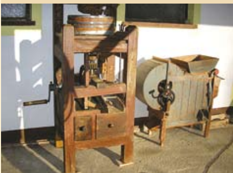
Levo ročne žrmlje za mletje žitaric, desno "bint" za "vejanje" (čiščenje) žita.