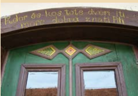
Vhodna vrata z značilnim šaljivim napisom.