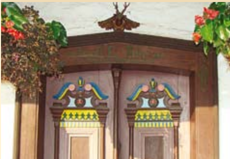
Detalj z vhodnih vrat.