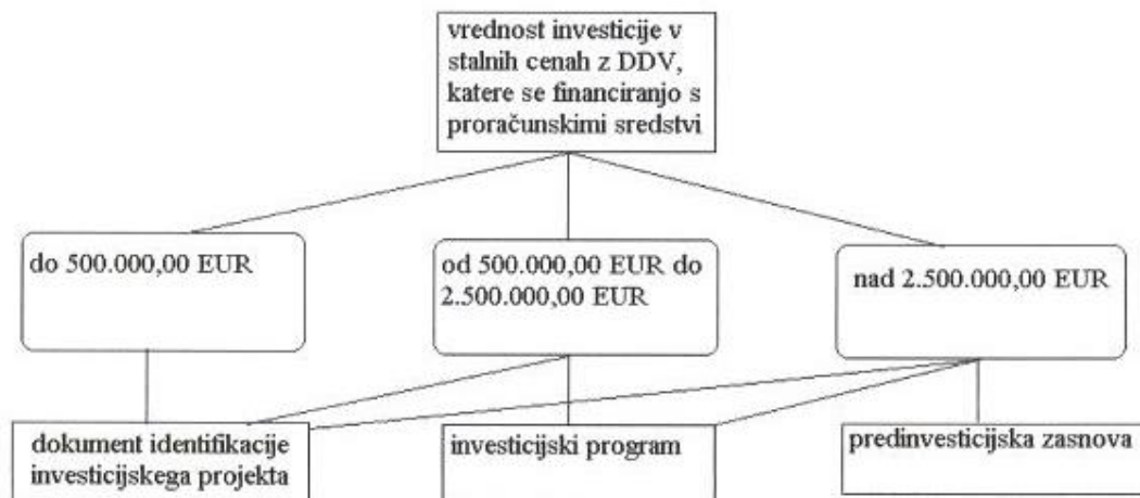
Slika 6: Mejne vrednosti investicij in potrebni investicijski dokumenti

Z vsemi dosedanjimi ugotovitvami pridemo do zaključka, da je z investicijo smiselno nadaljevati. Glede na vrednost investicije ni potrebno izdelati investicijskega programa.