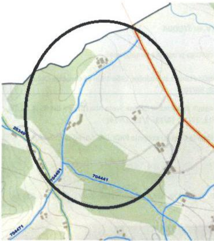
Slika 4: Lokacija javne poti – prikaz prometne infrastrukture