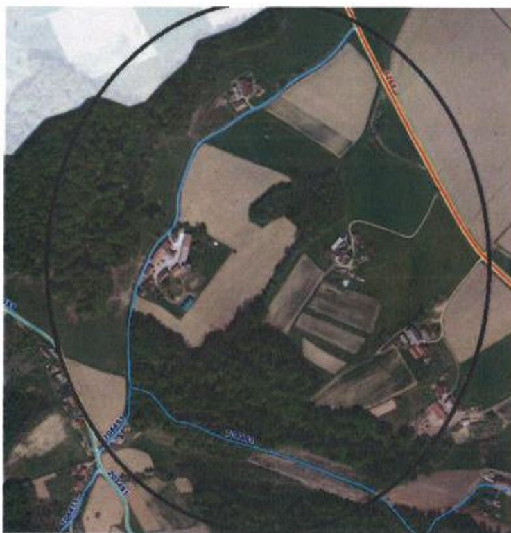
Slika 3: Lokacija obnove javne poti

Obnova javne poti obsega dela na JP št. 704 281 na naslednjih parcelah: 628/1, 633 v k.o. 510 Sp. Dražen Vrh.