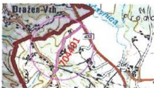
Slika 2: Lokacija ceste

Cesta je namenjena lokalnemu prometu lažjih vozil, med katera sodijo osebna vozila, polpriklopniki, traktorji in ostali kmetijski stroji ter periodično težkem tovornem prometu (odvoz smeti, ...).