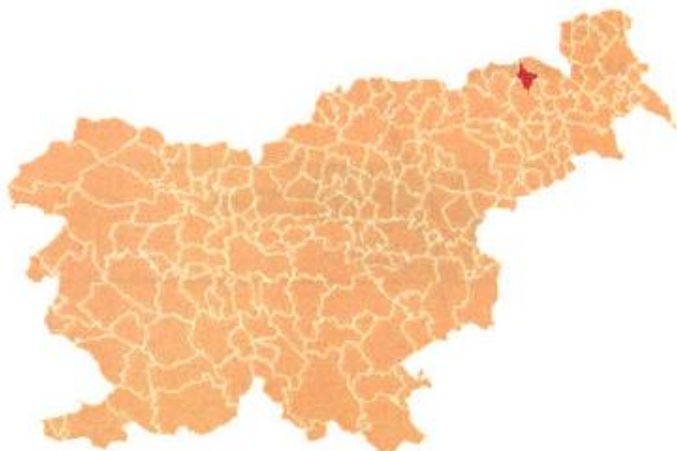
Slika 1: Lega občine Sveta Ana v Sloveniji

Občina Sveta Ana je del podravske statistične regije. Meri 37 km 2 . Po površini se med slovenskimi občinami uvršča na 156. mesto